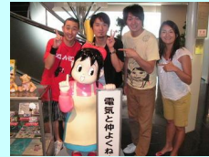
大宮ソニックシティの30階にあるテブコソニックに「電気とくらし」について学びにきたメンバー。